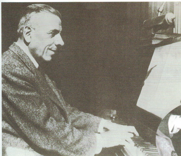
上/ピアノを弾くプーランク 右/プーランクの手