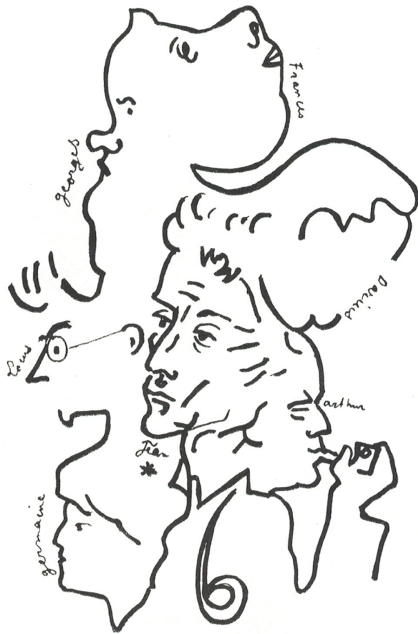
Le Groupe des Six et Jean Cocteau. Dessin de Jean Cocteau.

最後にダイナミックスについて少し触れておきましょう。⑬ 1994年に改訂された現行版では冒頭が mf 、5小節目が f 、9小節目を mf としています。⑭ 1958年版では冒頭が p 、5小節目 f 、9小節目 fp (ピアノ・パート) となっています。この fp は冒頭部分と変化