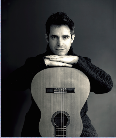
レオナルド・ブラーボ (クラシックギター)

アルゼンチンが世界に誇るギタリスト。国立ロサリオ大学芸術学部音楽学科修了。ギタリスト、作曲家として数々の賞を受賞。'09年米国マーシャル大学よりジョン・エドワード特別芸術賞を受賞。'10年レオナルド・ブラーボタンゴ楽団を結成。CD "El entrevero" と "El alma en la raiz" はイギリスとフランスのギター誌で高く評価されている。'08年ギターを学ぶ人のための作品集 "五つの小品" をフォレストヒルエディションより、'13年タンゴ名曲編曲集を現代ギター社より出版。クラシックはもとより、アルゼンチンタンゴ、フォルクローレに造詣が深い。